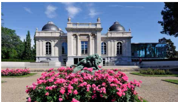
LA BOVERIE Parc de la Boverie • 4020 Liège