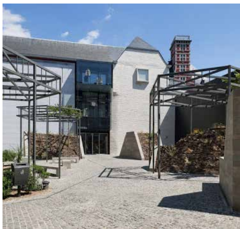
Cour principale du Grand Curtius © www.erikdhont.com

Les cours extérieures du musée ont également été pensées par un architecte paysagiste : Erik Dhont. Dans la cour principale, il a réalisé des volumes abstraits en briques de taille et formes différentes. Leur position dans le paysage signale aux visiteurs les parcours possibles de déambulation. Les briques des fontaines ont été récupérées des maisons démolies lors de la construction des bâtiments contemporains.