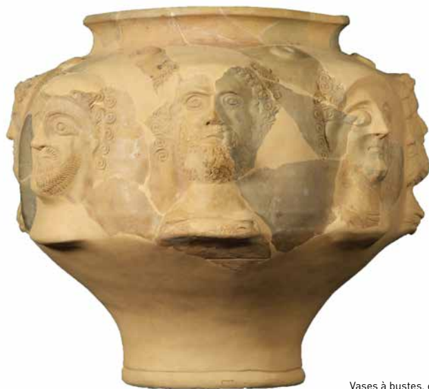
Vases à bustes, époque gallo-romaine, Terre cuite, Jupille © Ville de Liège

Grâce aux archives et aux différentes campagnes de fouilles réalisées à Jupille, les archéologues ont aujourd'hui une bonne connaissance du site à l'époque romaine. Entre le I er et le III e siècle, Jupille est une agglomération qui appartient à la cité de Tongres en Germanie inférieure. L'agglomération est la première étape entre Tongres et Trèves. La position stratégique de cette agglomération a donc favorisé son développement. Aujourd'hui, on sait que Jupille accueillait deux types d'activités artisanales, d'une part, des activités de métallurgie prouvées par la découverte de forges et, d'autre part, des activités de poteries attestées par la découverte de fours et de restes de céramiques. L'importance de la cité se traduit aussi par la présence d'un sanctuaire dédié à Apollon. Situé le long de l'artère principale de l'agglomération