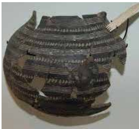
Biface cordiforme - Paléolithique inférieur (- 300 000), Visé, département d'archéologie, Grand Curtius

Le Néolithique (du grec néo = nouveau ; lithique = pierre), est la période la plus récente de la Préhistoire, durant laquelle la pierre est taillée mais aussi travaillée par polissage. Cette période de l'humanité est marquée par de profondes mutations techniques et sociales, liées à l'adoption par les groupes humains d'une économie de production fondée sur l'agriculture et l'élevage, impliquant le plus souvent une sédentarisation des peuples. Ainsi, l'homme n'est plus tributaire de la nature mais possède pour sa survie une réelle emprise sur son environnement en produisant ses propres ressources.