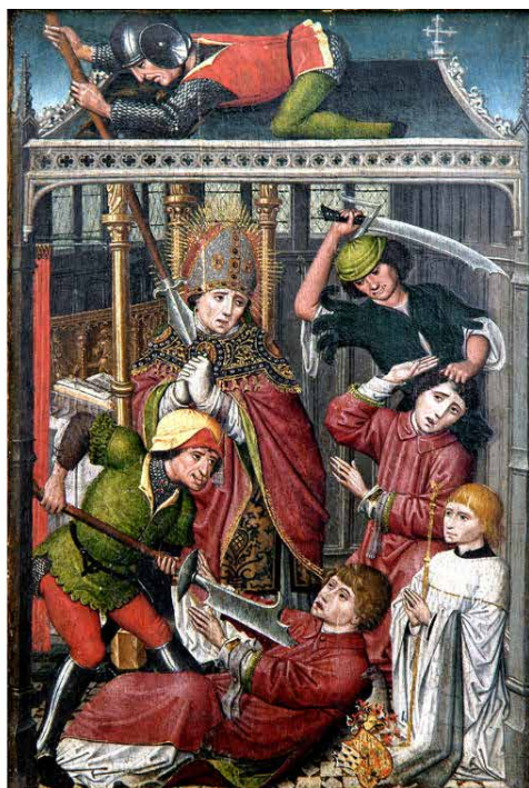
Diptyque de Palude, huile sur panneaux, Liège, après 1488, Grand Curtius