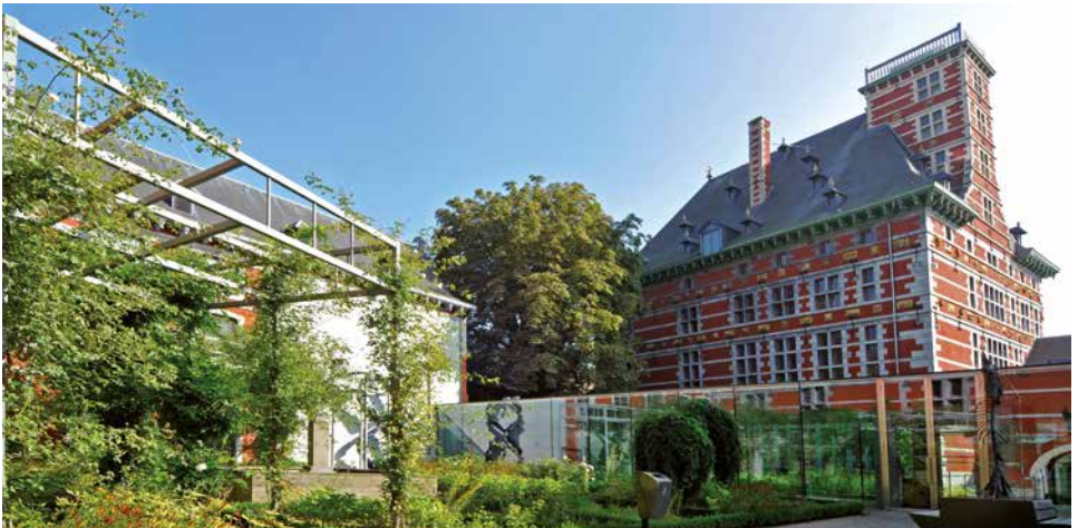
Vue du palais Curtius depuis la cour de la résidence