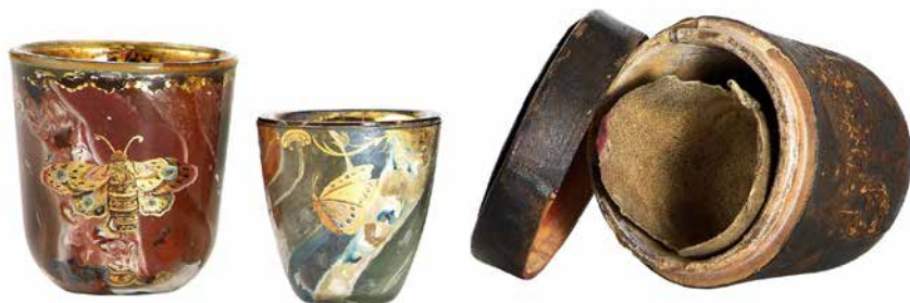
Gobelets de voyage, 18 e siècle, Bohême

Le 18 e siècle est l'âge d'or du verre de Bohême (actuelle Tchéquie), supplantant le cristal anglais et surtout vénitien qui dominaient la production verrière en Europe. La Bohême s'impose grâce à une organisation tournée vers le commerce international et un règlement interne protectionniste. Les ateliers verriers mettent au point un cristallin d'une grande pureté, obtenu grâce à un quartz et à une potasse de bonne qualité, auxquels sont ajoutés de la chaux. La découverte de nouveaux procédés de décoloration par le bioxyde de manganèse dénommé « le savon des verriers » permet d'obtenir ce cristal plus limpide. Dans leurs productions façonnées dans ce matériau plus épais, les artisans parviennent à exprimer tout leur savoir-faire grâce à l'utilisation de deux techniques décoratives : une taille plus profonde et la gravure à la roue. Celle-ci, introduite vers 1600 par Caspar Lehman, graveur à la cours de Rodolphe II à Prague, affine la réalisation de décors d'armoiries, de rinceaux de feuillages, de fleurs, mais aussi de scènes de genre et religieuses. Aujourd'hui encore, dans l'inconscient collectif, le cristal de Bohême reste la référence.