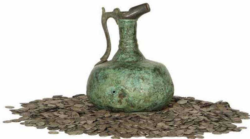
Trésor monétaire de Vervoz, époque gallo-romaine

Au 3 e siècle, les populations germaniques, chassées par les Huns, entament un mouvement migratoire vers l'ouest de l'Europe et entrent dans le territoire de l'Empire romain. Les Francs mènent des pillages sur le territoire de la Gaule Belgique. On parle d'invasions barbares car, pour les Romains et Gallo-romains, tous ceux qui ne parlaient pas le latin étaient considérés comme des barbares. Usé par ses conquêtes et attaqué de tous côtés par les peuples barbares venus de l'Est et du Nord, l'Empire romain chancelle. Les Francs étaient originaires de la Germanie. Cherchant des terres fertiles, ils traversent le Rhin, livrent des combats acharnés et s'étendent de plus en plus dans notre pays et une grande partie de la Gaule. Ils fondent plusieurs états indépendants mais gouvernés par des princes d'une même dynastie, la dynastie mérovingienne. Ce sont eux qui vont donner naissance à la première dynastie des rois de France. Cela marque la fin de l'Antiquité gallo-romaine et le début du Moyen-Âge.