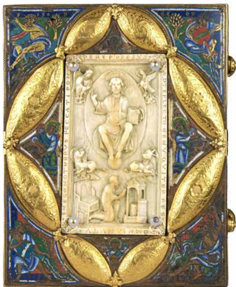
Évangélaire dit de Notger, manuscrit : Reims (?), vers 930 ; ivoire : 11 e siècle ; émaux : vers 1160 ; plaques gravées : 15 e siècle, Grand Curtius

De 972 à 1008, le diocèse de Liège est dirigé par l'évêque Notger. L'Empereur germanique, Otton Ier, lui confère le titre de prince-évêque et l'envoie dans cette région turbulente convoitée par le roi de France. Liège devient une principauté ecclésiastique sur laquelle Notger a tous pouvoirs, à la fois civils et religieux. Riche et puissant, Notger se lance dans une politique de grands travaux : il fait entourer la ville d'une enceinte à l'intérieur de laquelle il fait bâtir 7 collégiales et 2 abbayes, sans compter l'imposante cathédrale Notre-Dame-et-Saint-Lambert située à côté de son nouveau palais épiscopal, symbole de sa puissance religieuse et politique.