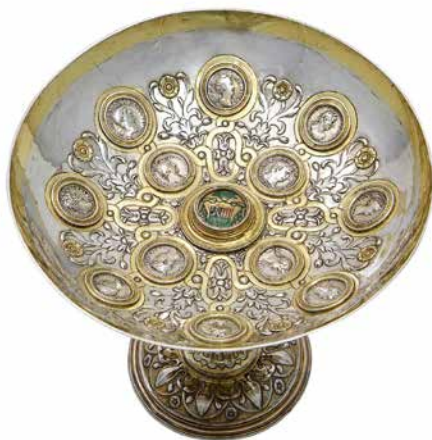
Coupe Oranus, argent, poinçon du maître orfèvre GH ou HG, Liège, 1564

Forgé dans la seconde moitié du 19 e siècle, le terme d'humanisme désigne un courant intellectuel et artistique, né en Italie au 14 e siècle, qui reconnaît l'Homme comme un individu à part entière, ayant des capacités intellectuelles illimitées, une place centrale dans la création et surtout une existence indépendante de la bonté divine. Connaître la réalité, le monde et son fonctionnement, c'est avoir la possibilité d'agir pour la changer. L'idée directrice de l'humanisme est la volonté de faire renaître le monde antique et d'en égaler la grandeur.