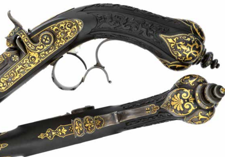
Paire de pistolets à silex, Geerinckx, 1889

Au 16 e siècle, des mécanismes plus simples basés sur le principe que celui du briquet font leur apparition. Un morceau de silex taillé en biseau maintenu par le chien, heurte une pièce métallique (batterie) lors de la pression sur la queue de détente. Le choc provoque une gerbe d'étincelles qui tombent dans le bassinet renfermant la poudre d'allumage, en relevant le couvre-bassinets. Plus fiable que la platine à mèche et plus économique que la platine à rouet, ce système va s'imposer pendant plus de 2 siècles dans toute l'Europe.