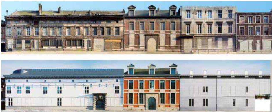
Vue de l'élévation des bâtiments du musée, avant et après les aménagements de Daniel Dethier

Ces bâtiments historiques sont liés entre eux par des aménagements architecturaux contemporains, créant une circulation cohérente et presque imperceptible entre les différentes constructions des différentes époques.