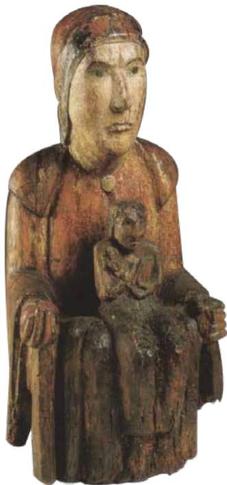
Sedes Sapientiae dite Vierge d'évegnée, bois polychromé, région mosane, vers 1060, Grand Curtius © Ville de Liège

Cette Vierge à l'Enfant est une Sedes Sapientiae (en latin - siège de sagesse). La vierge assise fait corps avec son siège, elle matérialise le trône de la Sagesse incarné par son Fils. Dans une de ses mains elle tient une pomme, la Vierge est la « nouvelle Eve » qui permet le rachat de la faute originelle en donnant naissance au fils de Dieu. L'Enfant, ressemble plutôt à un adulte miniature. D'une main, il bénit à la manière latine (deux derniers doigts repliés) et, de l'autre, il tient un livre. Il n'y a aucun geste d'affection entre la mère et son fils. Elle est même plutôt sévère. Les quelques traces de polychromie sont d'origine ; la facture est archaïque, quasi schématique. Les reliefs sont réduits à leur plus simple expression, notamment dans le rendu de l'anatomie et des vêtements. Endommagée par le feu, l'oeuvre est aujourd'hui partiellement amputée. Il s'agit d'une des plus anciennes Sedes Sapientiae mosanes.