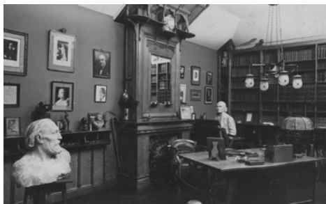
Photo d'archive du studio (cf catalogue GC p. 129)

Créé en 1884, ce cercle artistique se compose dans un premier temps de vingt fondateurs issus du monde artistique bruxellois : on retrouve entre autres Théo van Rysselberghe, Fernand Khnopff, James Ensor mais aussi quelques journalistes, écrivains et critiques d'art influents. Le Groupe des XX s'est constitué suite à un refus de participation de certains peintres au Salon de Bruxelles de 1884. « Qu'ils exposent chez eux ! », avait dit un des membres du jury. Ce fut chose faite. Le Groupe des XX organise sa propre exposition, prônant avant tout une égalité entre les artistes. Il n'y a plus de jury de sélection et chaque artiste participant peut exposer 6 toiles. D'un point de vue stylistique, ce groupe réagit essentiellement contre l'académisme et se fonde sur le visible en s'intéressant à la nature et à la réalité sociale qu'il n'idéalise pas. Une dizaine d'années après, la dissolution du groupe a lieu mais la relève est assurée par la Libre Esthétique, en 1894.