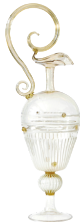
Aiguière, 2 e ½ du 16 e siècle – début du 17 e siècle, Catalogne, Espagne

Au début du 11 e siècle, Venise devient une des premières puissances maritimes et commerciales. La ville devient également un principal centre verrier d'Europe grâce à l'assimilation des techniques verrières d'Orient. En 1291, suite aux nuisances causées par les nombreux fours dans la ville, les ateliers des verriers sont transférés sur l'île de Murano toute proche. Une politique très protectionniste est mise en place : les artisans verriers sont menacés d'emprisonnement et même de mort s'ils dévoilent les secrets de fabrication. Le succès du verre de Venise est dû aux innovations techniques et décoratives dont les artisans ont su faire preuve. Vers 1450, ils inventent le cristallo, un verre limpide et incolore. Au 16 e siècle, ils mettent au point la technique décorative du filigrane qui consiste à inclure dans la masse de verre en fusion des filets de verre blanc ou colorés. Ces filaments peuvent former un réseau de lignes parallèles, spiralées ou entrecroisées. La renommée des artisans verriers vénitiens entraîne de nombreuses imitations à travers l'Europe qui seront appelées « à la façon de Venise ».