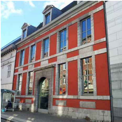
Hôtel de Brahy

Ces deux hôtels particuliers étaient à l'origine un seul bâtiment dont la construction remonte à la seconde moitié du 17 e siècle, sous le nom d'Hôtel de Haxhe, et construit par Conrad de Haxhe, bourgmestre de Liège en 1673. Architecture de briques et de pierre calcaire à linteaux, on peut y voir une évolution de l'architecture, notamment dans la disparition des fenêtres à croisées pour de grandes baies. Vers 1770, l'hôtel est divisé en deux parcelles qui vont se développer indépendamment l'une de l'autre par de nombreux propriétaires : la partie à rue (partie Brahy) et la principale au sud (partie de Wilde). Au 20 e siècle, l'immeuble devient propriété de la Ville et est utilisé comme entrepôt. Au début du projet muséal, la démolition de ces deux immeubles est envisagée mais ils sont en fin de compte restaurés et intégrés au plan général, pour l'accueil et la cafétéria du musée.