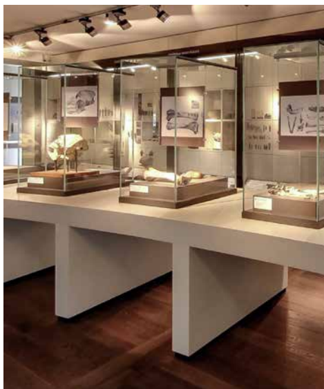
Vue d'ensemble du département Archéologie