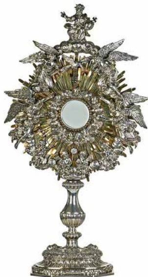
Ostensoir dit de la Fête Dieu, orfèvre Charles de Hontoir, argent et laiton, Liège, 1722

L'origine de cette fête du Saint-Sacrement remonte au 13 e siècle. C'est à sainte Julienne de Cornillon que l'on doit l'initiative de cette fête. Dès 1209, elle a des visions mystiques : une lune incomplète lui apparaît. Elle interprète cette vision comme le signe qu'une fête manque dans l'Église. Convaincue, elle travaille à l'établissement de la Fête-Dieu. Pour l'aider, elle sollicite l'aide de la Bienheureuse Eve de Liège, recluse à Saint-Martin. Le but de cette nouvelle fête est de ranimer la foi des fidèles, mais les bourgeois de Liège y sont opposés, car cela signifiait un jour de jeûne supplémentaire. Après le long combat de sainte Julienne, la fête est introduite dans le diocèse de Liège en 1246. À la mort de Julienne, Eve continue les démarches et parvient à imposer la fête dans l'Église universelle, en 1264.