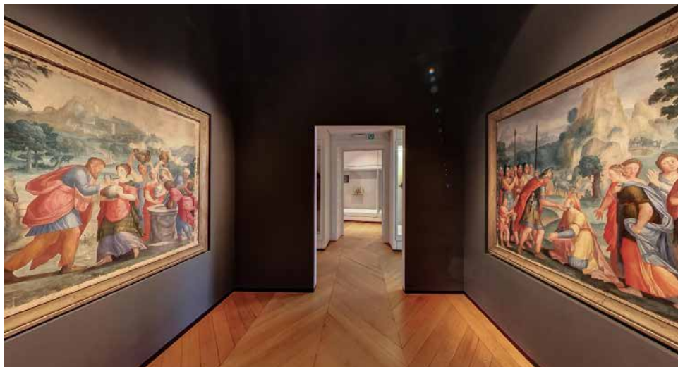
Lambert Lombard, Cycle des femmes vertueuses, vers 1530-1535, Liège, Beaux-Arts de Liège

Née à Florence, la Renaissance désigne une période de «re-nouveau» comprise entre le 15 e et 16 e siècle, selon les zones géographiques. En Italie, on parle de «première renaissance» ou de Quattrocento (qui correspond aux années mille quatre cents) pour le 15 e siècle. C'est la « seconde renaissance » qui gagne toute l'Europe au 16 e siècle (appelée aussi Cinquecento, années mille cinq cents). Considérée comme une rupture après le Moyen-Âge, la Renaissance s'inspire de l'Antiquité gréco-romaine, modèle socio-culturel à atteindre. Ainsi, très vite, un marché des reliques se met en place au Moyen-Âge. De « fausses reliques » se multiplient. Abbayes, couvents et églises sont confrontées à ce commerce douteux, mais aussi à de nombreux vols.