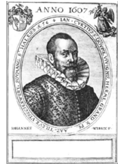
Jean Wirix, Portrait de Jean de Corte, gravure au burin, Anvers, 1607 – collection Grand Curtius

Grand capitaliste de son temps, l'industriel Jean de Corte (1551-1628) fait fortune dans la fabrication de poudre et de projectiles, dont il obtient le privilège de leur fourniture aux armées espagnoles dans les Pays-Bas. Il possède des terres, des seigneuries, des parts dans l'exploitation de charbonnages. En 1617, il crée même, au nord de l'Espagne, un complexe sidérurgique pour lequel il importe des machines et de la main d'oeuvre, les ouvriers liégeois ayant acquis un grand savoir-faire.