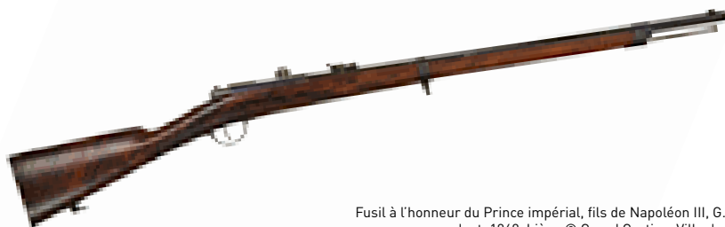
Fusil à l'honneur du Prince impérial, fils de Napoléon III, G. Mordant, 1868, Liège

Appelée à devenir Napoléon IV, le jeune Eugène Louis est le fils de Napoléon III et de la princesse Eugénie. Né en 1856, et ardemment désiré, il est rapidement surnommé le « petit prince » et ses parents lui passent tous ses caprices. L'enfant montre une fascination pour les uniformes et les armes et très tôt, il se passionne pour la vie militaire. A 14 ans, il suit son père dans la campagne Franco-prussienne en Lorraine. Séparé de son père, après la défaite, il se réfugie en Belgique et retrouve ensuite sa mère en Angleterre. Ils sont ensuite rejoints par l'empereur déchu. Alors à la tête de la famille Bonaparte, le jeune homme est appelé à relever l'Empire. Pourtant, à 23 ans, ayant rejoint l'armée Anglaise, il est envoyé au Zoulouland, colonie britannique en proie à la révolte. Il y trouve la mort en 1879 dans une embuscade.