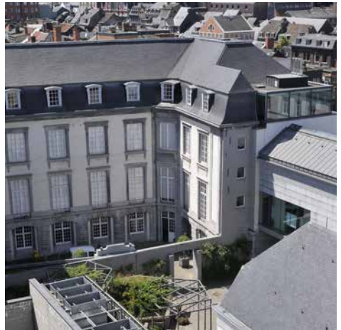
Hôtel de Hayme de Bomal

Reflète de l'architecture néoclassique de la seconde moitié du 18 e siècle, l'Hôtel de Hayme de Bomal est l'exemple parfait de l'architecture à la française, dans la tradition des hôtels parisiens de la fin du 18 e siècle, comprenant des appartements de parade au premier étage. La construction est attribuée à l'architecte Barthélemy Digneffe pour Jean-Baptiste de Hayme de Bomal, un important bourgmestre de Liège. L'hôtel sera ensuite le siège de la préfecture du département de l'Ourthe et Napoléon Bonaparte y loge deux fois (avec ses deux épouses différentes). Il est ensuite siège de l'administration hollandaise, avant de devenir la propriété de Pierre-Joseph Lemille qui la cède en 1884 à la Ville pour en faire le Musée d'Armes.