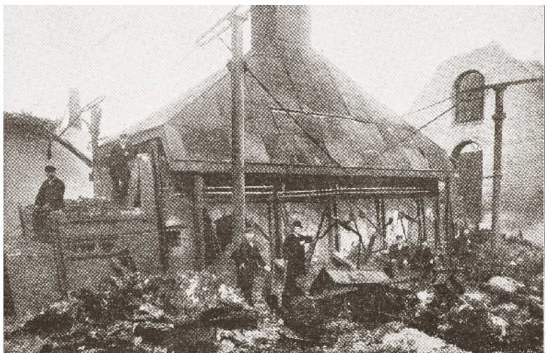
Incendie et pillage de la verrerie et du château de M. Eug. Baudoux. La verrerie Baudoux après l'incendie – Le four à couleurs. Zwart-witfoto's uit een boek van 71 pagina's, 18,5 x 27,5 cm.