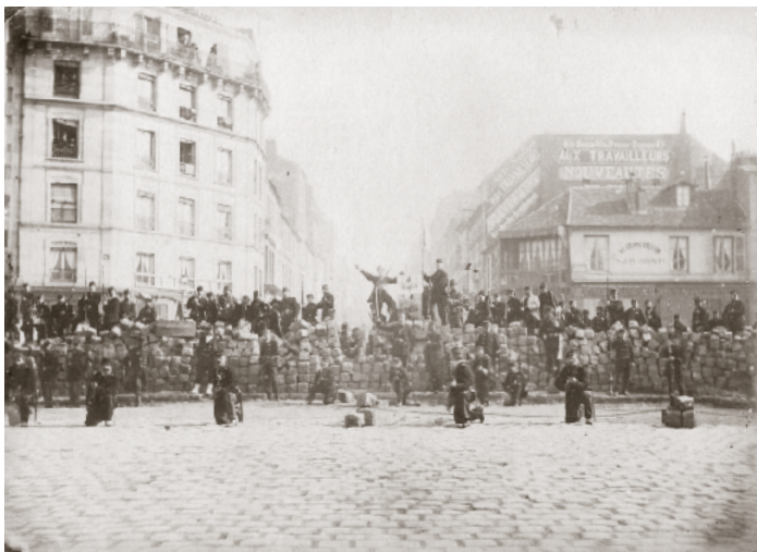
Barricade de la chaussée Ménilmontant et rue Oberkampf, maart-mei 1871,