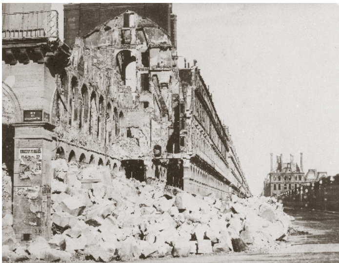
Rue de Rivoli, 1871