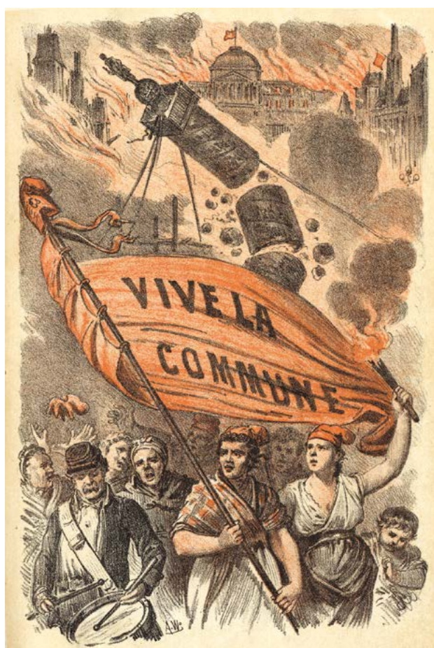
Vive la Commune , illustratie door A. W., uit het werk van Raoul Rigault, La Commune de Paris : anales de la revolución francesa de 1871 , Barcelona, Casa editorial de José Codina, 1871.

Omslag : La barricade de la place Blanche défendue par des Femmes , (detailmet verrijkte kleuren), illustrator onbekend, na 1871.